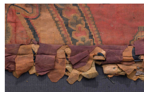
Détail bordure de franges en taffetas.