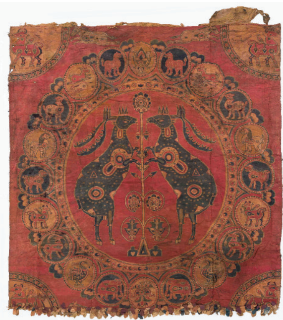
N° inv. 5682 : 173 cm sur 196 cm. Comme mesure préalable au lavage, l'endroit et l'envers du textile ont été dépoussiérés par micro-aspiration.